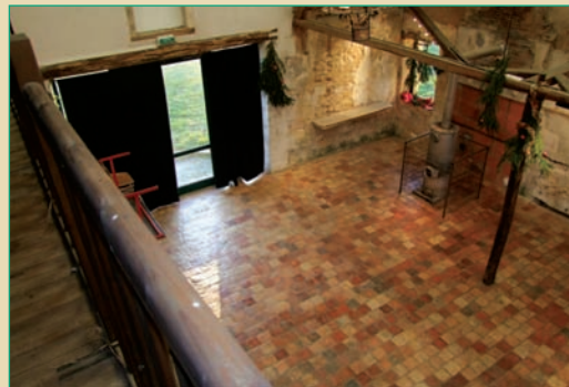
L'espace de travail ne comporte ni scène, ni régie.