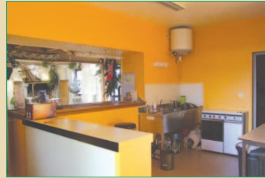
Cuisine équipée et coin repas.