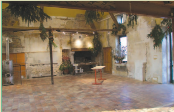
Superficie de la salle : 100 m 2 environ.