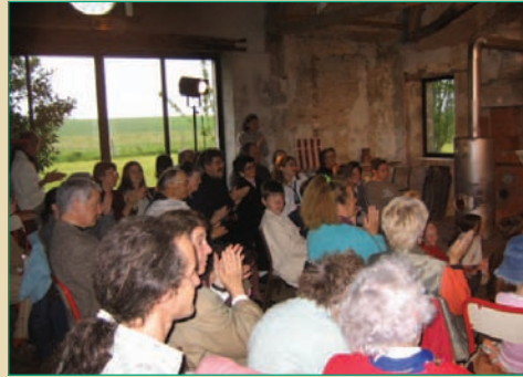
Capacité d'accueil 80 personnes assises ou 100 debout.

Dans cette ancienne maison de meunier devenue lieu de rencontres et d'échanges en milieu rural, l'association organise tout au long de l'année des manifestations culturelles, des spectacles (théâtre, concerts), des manifestations en plein air.